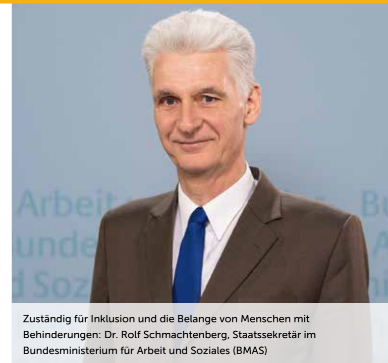
Zuständig für Inklusion und die Belange von Menschen mit Behinderungen: Dr. Rolf Schmachtenberg, Staatssekretär im Bundesministerium für Arbeit und Soziales (BMAS)

Bandscheibenvorfall, Kontaktallergie oder Burnout: Eine gesundheitliche Einschränkung kann jeden jederzeit treffen – und für den Beruf oft das Ende sein. Doch die deutsche Gesetzgebung hat einen rechtlichen Rahmen geschaffen, damit die Betroffenen eine zweite Chance im Arbeitsleben bekommen: Wie Menschen nach einer Krankheit oder einem Unfall wieder zurück in den Arbeitsmarkt finden können, zeigen die Fachleute aus dem Bundesministerium für Arbeit und Soziales (BMAS) auf.